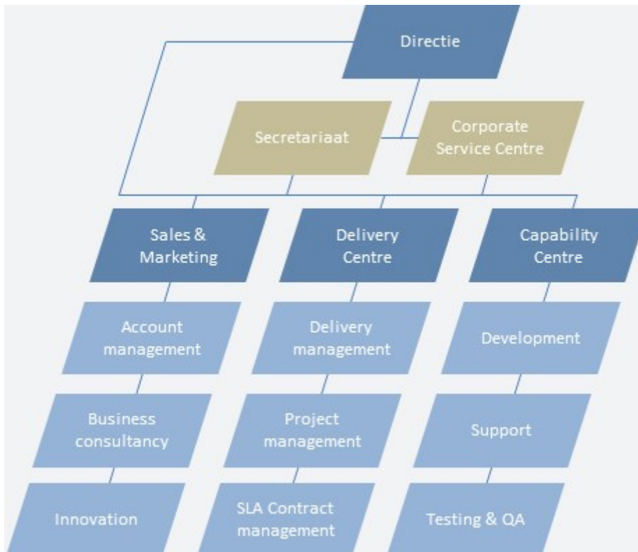
Figuur 1: Organogram InTraffic.

Deze scope 1 en scope 2 CO 2 -footprint is van toepassing op InTraffic B.V. Het organogram van InTraffic is weergegeven in onderstaand figuur. Hierin hebben geen wijzigingen plaatsgevonden.